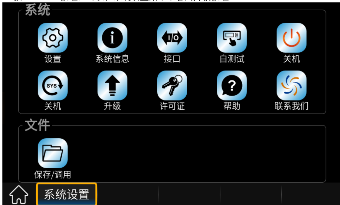
图 1 系统设置菜单