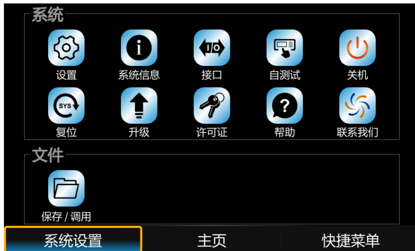
图 1 系统设置菜单