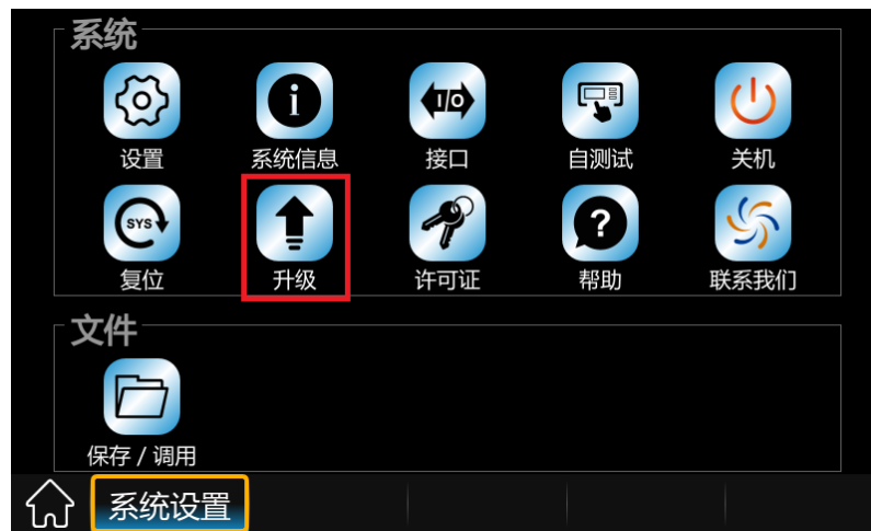
图 1 系统设置菜单