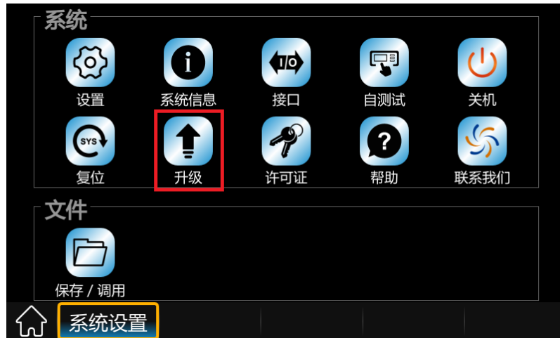
图 1 系统设置菜单